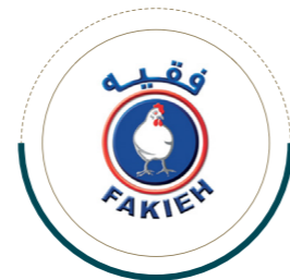
شركة مزارع فقيه للدواجن