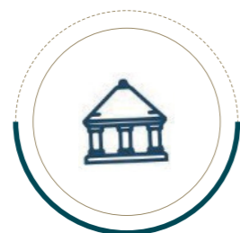
متحف وملتقى محاري الثقافي