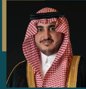
صاحب السمو الملكي الأمير فيصل بن نواف بن عبد العزيز أمير منطقة الجوف رئيس مجلس الأمناء