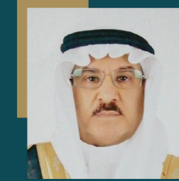
معالي أ.د فهاد بن معتاد الحميد