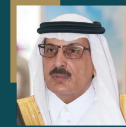
معالي د.عبدالواحد بن خالد الحميد