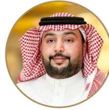
د. ماجد بن أحمد الفياض رئيس لجنة تقنية المعلومات