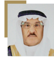
معالي أ.د. فهاد بن معنات الحميد