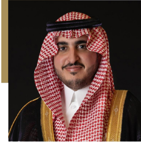
صاحب السمو الملكي الأمير فيصل بن نواف بن عبد العزيز أمير منطقة الجوف رئيس مجلس الأمناء